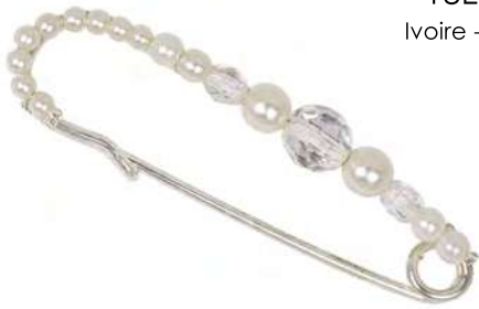
18E950 Ivoire - Blanc