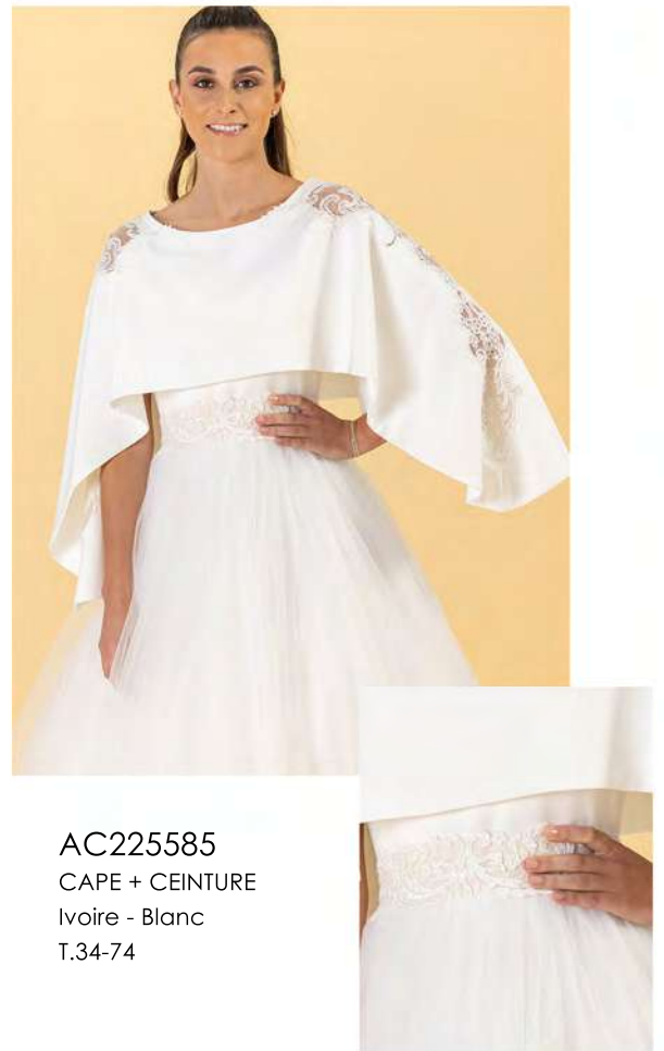
AC225585 CAPE + CEINTURE Ivoire - Blanc T.34-74