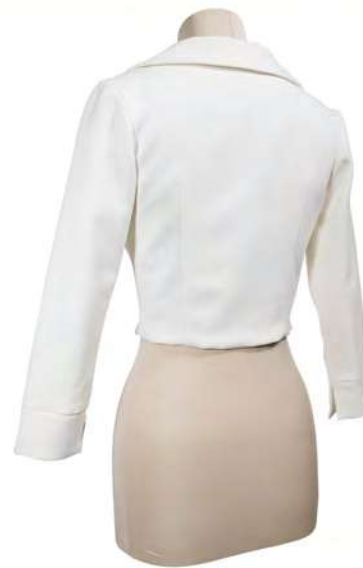
JA801 Ivoire T.34-74