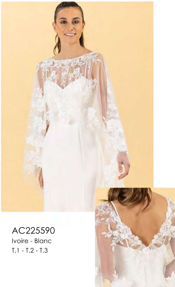
AC225590 Ivoire - Blanc T.1 - T.2 - T.3