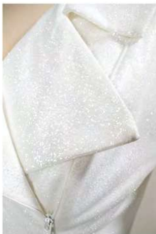
JA802 (paillettes) Ivoire T.34-74