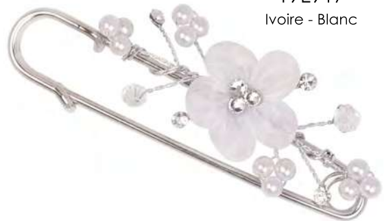
19E917 Ivoire - Blanc