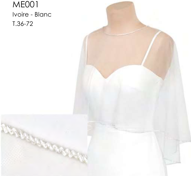
ME001 Ivoire - Blanc T.36-72