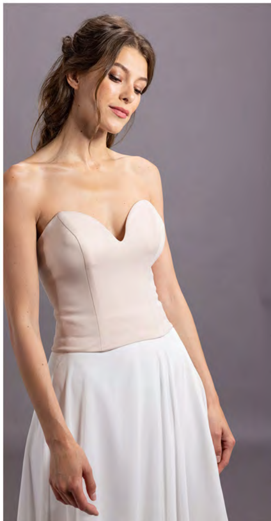
B.DOUBLURE Ivoire - Blush - Marron T.34-74